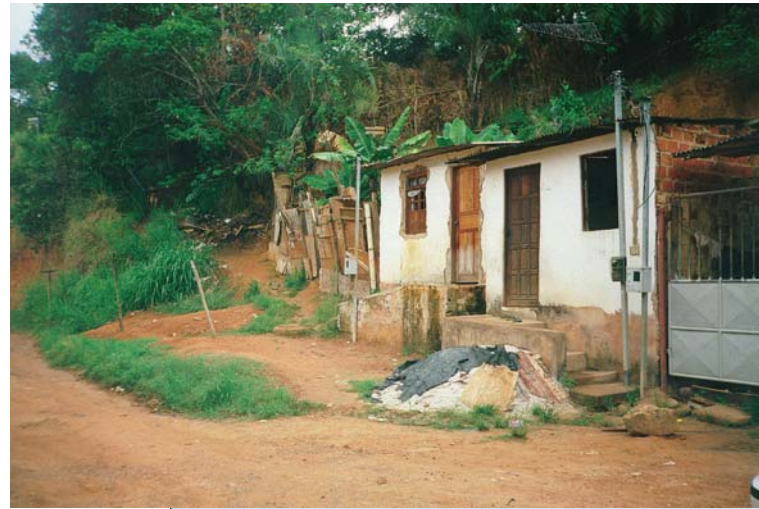
Favela Bate Facho, 2001